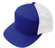
Royal / Blanco