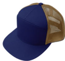
Marino / Beige