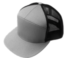
Gris / Negro