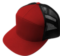
Rojo / Negro