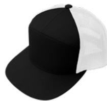
Negro / Blanco