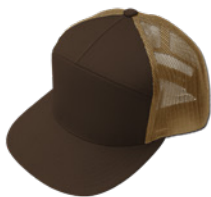
Café / Beige